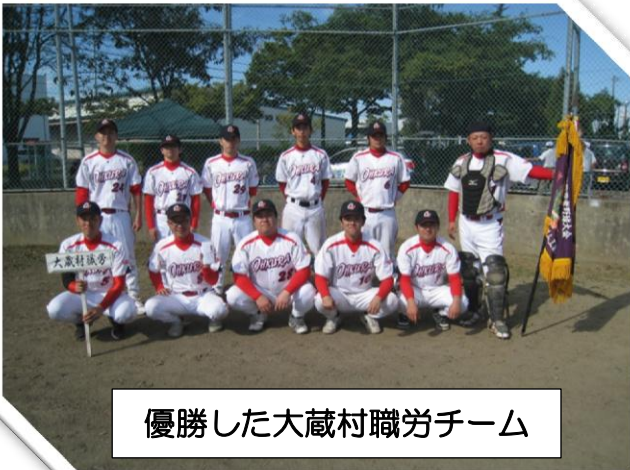
優勝した大蔵村職労チーム